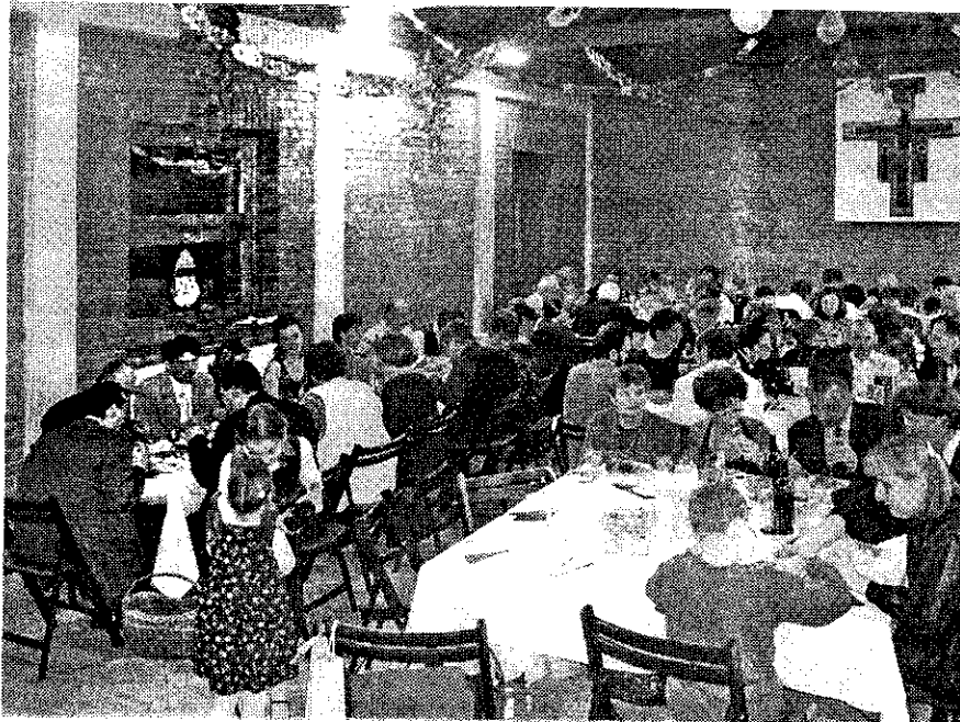
FARSANGI BÁL A PÉTBÁNIÁN. Január 14-én közel 100 fő vett részt a másnap hajnalig tartó egyházközségi farsangi bálban. Köszönet a szervezőknek a szíves vendéglátás, zeneért és a finom vacsoraért.