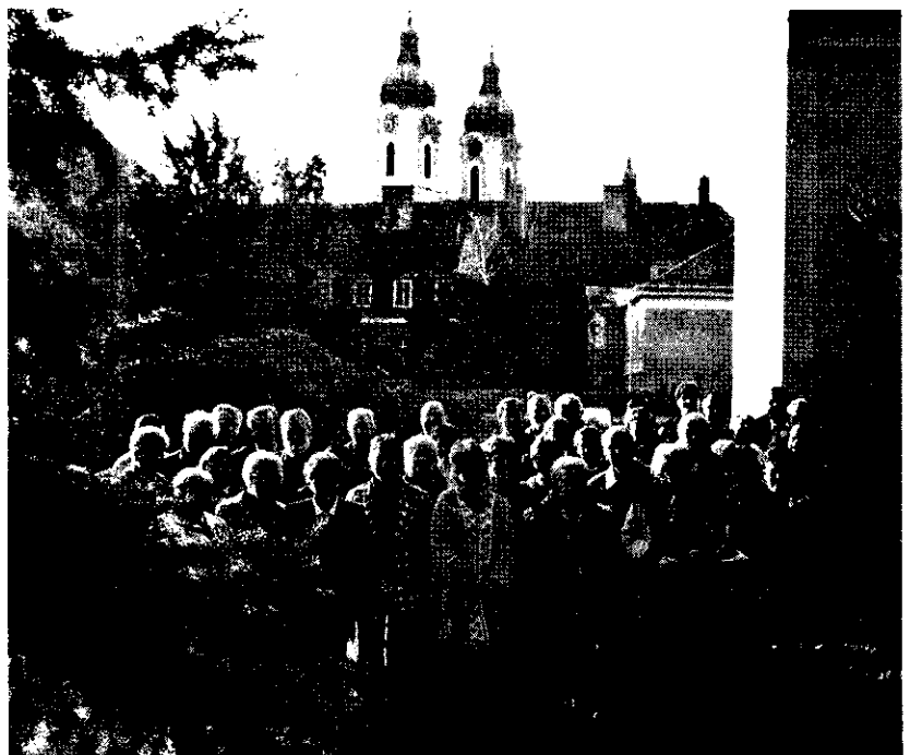
A képviselőtestületi tagok a kalocsai érseki palota udvarán