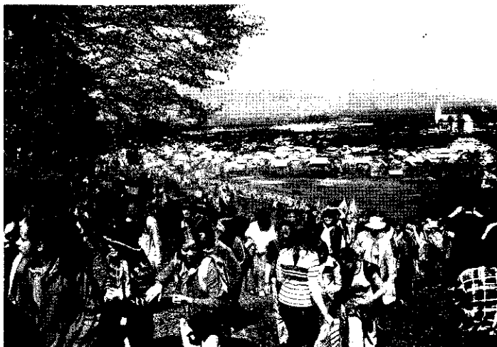
Az utolsó erőpróba