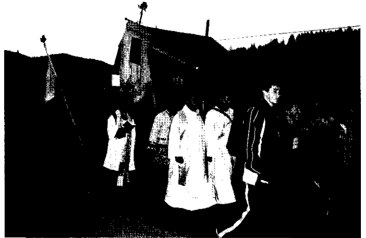
Mieink a sorban