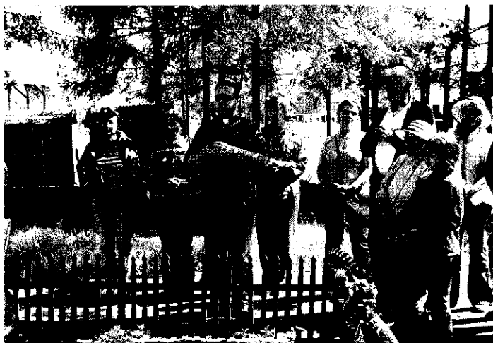
Tamási Áron sírjánál