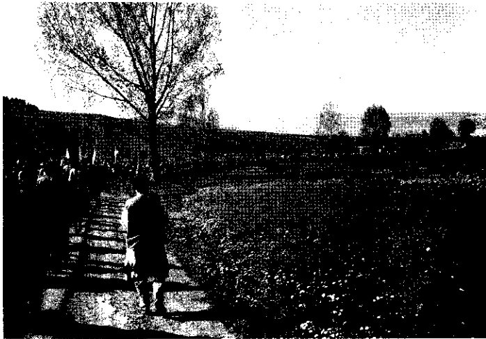
Faluköznyi emborsor kíséri a keresztet Csíksomlyóra