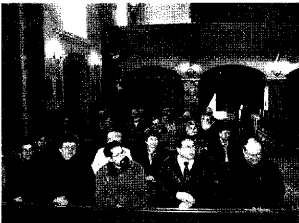
A képviselő testület tagjai a dunaföldvári plébániatemplomban