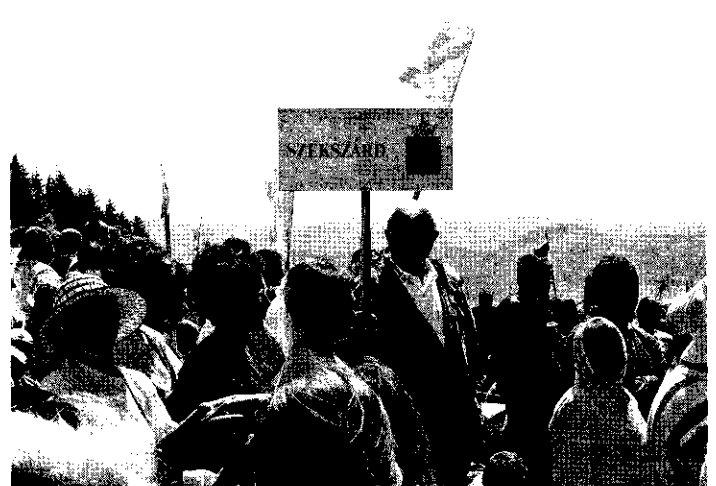
Szekszárdiak táblája Csíksomlyón