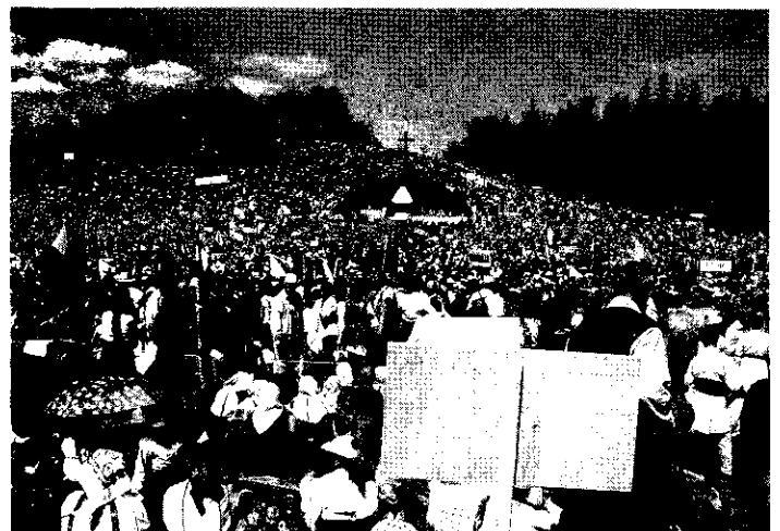
A mise helyszínén