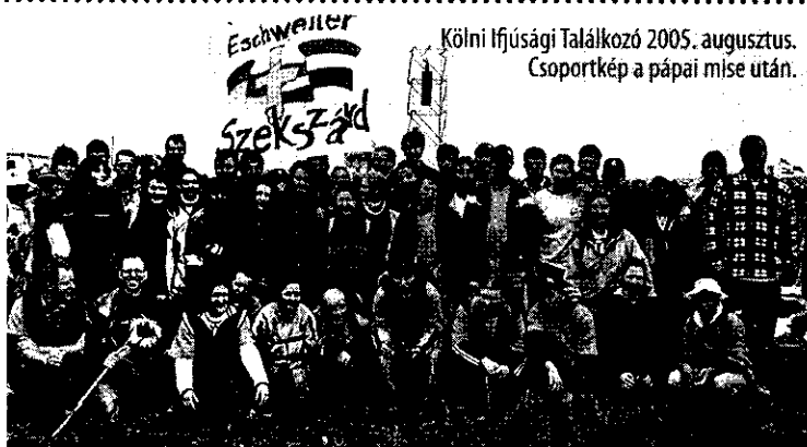
Kölni Ifjúsági Találkozó 2005. augusztus. Csoportkép a pápai mise után.

12./2005. évi határozat: A Szekszárdi R.K. Egyházközség tisztelettel kéri a megyéspüspök urat, hogy tagjai lelki gondozásának érdekében szíveskedjen mielőbb Belvárosi Plébániánkra munkabíró, magasfokú lelkiességgel élő, dolgozó káplán atyát biztosítani, aki plébánosunkkal jól együttműködve a tartósság reményével foglalhatja el helyét.