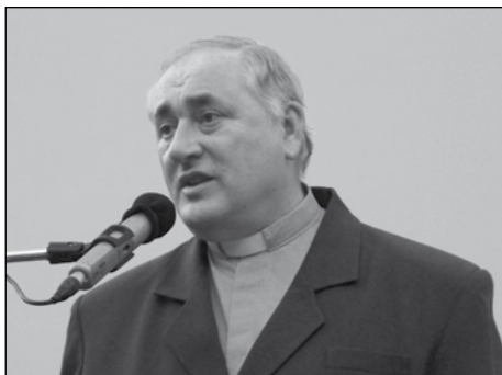
BÍRÓ LÁSZLÓ tábori püspök

„Az ősök, az alsóvárosiak megfogadták, hogy megépítik, és az utódok rendben fogják tartani. És ma boldogok lehetünk, hogy a kápolna megint szakrális jelleget kap, mint amilyen szakrális jelleget adtak neki 250 évvel ezelőtt. Köszönöm mindenkinek, aki hozzájárult, aki segített, és azoknak is, akik ma eljöttek hálát adni.”